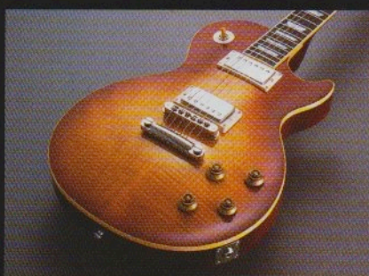
AAフィガード・メイプル・トップ & よりオリジナルに近づいたバースト・フィニッシュ