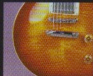
Heritage Cherry Sunburst