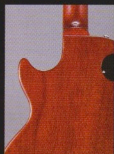
よりオリジナルに近づいたバック・カラー