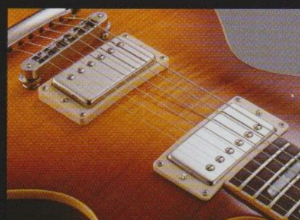
新開発“バースト・バッカー5”ピックアップ搭載