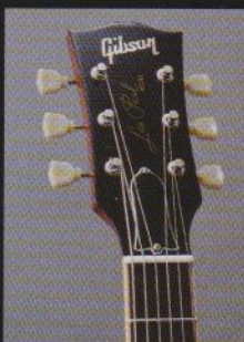
ヴィンテージ・スリム・ヘッド・シェイプ&クルーソン・スタイル・ブッシュウイン・チューナー